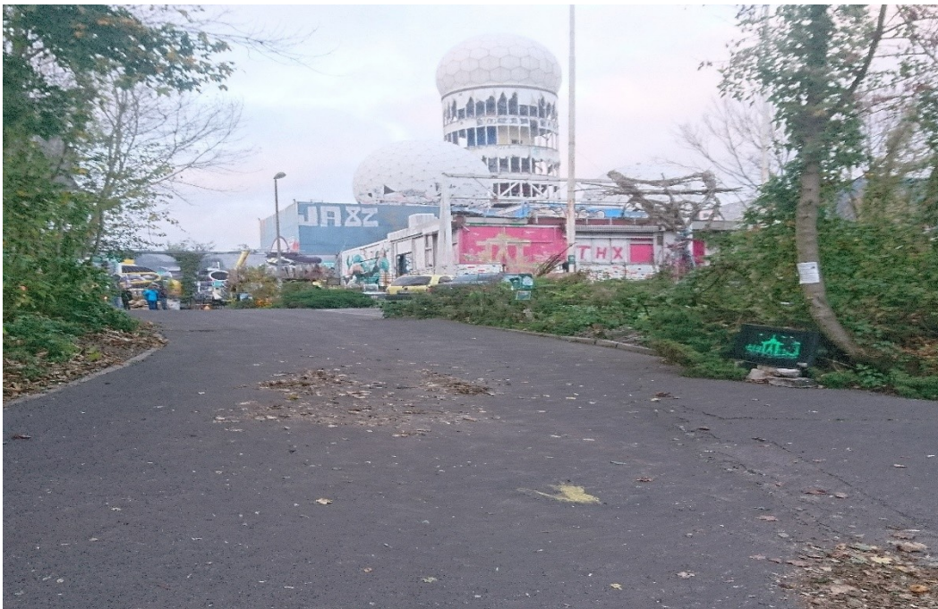
(Zieleinlauf auf dem Teufelsberg Gelände)

Der Teufelsberg Run ist eine Veranstaltung für Sportler, Spitzenathleten und Freizeitsportler und fordert alle gleichermaßen heraus. Der 1. SCB Berlin Teufelsberg Run will Euch ein außergewöhnliches Lauferlebnis bieten. Das Wetter, der Wind, das Eis und der Berg bestimmen das Bild vom Berliner Teufelsberg Run. Schnee, Kälte und Eis werden bei der Veranstaltung den Teilnehmern in frischer Erinnerung bleiben, aber mit etwas Glück erwarten Euch vielleicht auch sonnige, fast frühlingshafte Bedingungen. Egal wie das Wetter wird, der Teufelsberg wird für einen Kampf sorgen. Bist Du bereit?